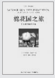
埃里克·奥森纳 著 杨祖功 译 新星出版社 2009年3月出版

法兰西学院院士埃里克·奥森纳游历探访五大洲七个主要棉花种植国后写成的这部游记或曰考察报告，在法国学界和普通读者中均引起轰动。欧洲电视台(Arte)几乎同步播出了由著名摄影家随同访问时摄制的纪录片《在棉花的路上》，随即引起全球业界和广大观众的关注。本书认为，人类历史上第一次全球化是围绕棉花生产自动形成的。作者很早就想沿着棉花之路去旅行，探访农业、纺织业还有生物化学工业，而这场游历和探访，让他从巴西、中国、印度的“崛起”，非洲被“冻结”，欧洲和法国的“怠惰”以及世界银行和“世界级银行家们”的夜郎自大中，看到了当前全球性的重大变化。