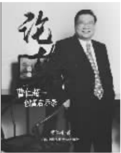
《论势》 曹仁超 著 中国人民大学出版社 2009年5月出版

由一个年轻中国作者来写一位世界级投资大师第一本传记，这样甜蜜自然是我们想要的和期望的，毫无疑问，《水晶球》向我们展示一个更为饱满和全面的罗杰斯形象。但同样的投资成功或者未来未必降临，虽然他甜蜜之余说的都是真心话。可你不知道，中国的市场离他其实很远。