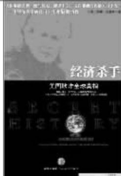
《经济杀手：美国欺诈全球真相》 约翰·珀金斯 著 曾贤明 译 中信出版社2009年3月出版

不得不说，世行、美跨国公司第三世界政府之间的三角关系，实在是一个难以解决的矛盾。亚非拉经济落后国家，如果不依靠美国的跨国公司相助获得世行的贷款，就无法得到足够的资金来建设国内电