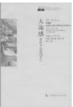
《大流感》 ——最致命瘟疫的史诗 (美) 约翰·M·巴里 著 钟扬 等译 上海科技教育出版社 2008年12月出版

《信报》是内地不少投资人非常喜欢的香港财经报纸，之所以喜欢，是因为该报两位超人气大腕林行止、曹仁超的专栏。林的专栏天地北、政经、文化、科学、艺术无所不谈，所编集子《内地已经先后出了多种》曹先生的文字，似乎只谈股票、基金、外汇、黄金投资，且用广东话写作，非粤语地带的人读起来总不免有些吃力，有些“隔”。这次，坚信500年风水流转，而未失势在老曹，终于让他多年的观察与思考的结晶——《论势》、《论战》、《论性》在内地推出了普通话版。 目前先上市的是《论势》。关于“势”，老曹的分析有大