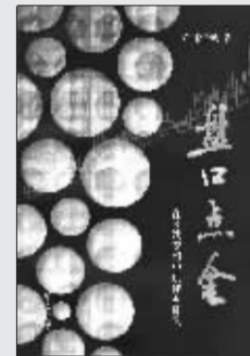
徐子城 著 上海财经大学出版社 2009年4月出版

作者具有丰富的操盘经验，以捕捉黑马股及大牛股而见长，曾著有“股市天元”系列多部有市场影响力的著述。他认为股价的运动是有灵魂、有生命，又与智慧高度结合的盘面艺术。本书继承了传统“蜡烛图”理论的精华部分，又结合多空双方在实盘博弈过程中的种种转换过程，对很多经典技术作了新的诠释。另外，还用了相当的篇幅介绍了可以控制及左右价格走向的“成交量”系统、“移动均线”系统中最为精华、最为实用的精华部分。书中收录的不少作者在实战中整理出来的，只有在实盘操作过程中才能够遇到的特殊“蜡烛图组合”，使得本书的实用功能很强。