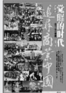
俞雷 著 中信出版社 2009年3月出版

这是一部1978年以来的中国商业变迁史，也是一代人的命运的沉浮史。作者通过对数万份国内外珍贵史料、档案、口述史的系统梳理，讲述了改革开放头12年中国不同舞台上闪现的“小人物”和“大事件”，诸如广告、外企、个体户、私营企业等等和商业有关的故事，试着在诸多看似不相关的商业事件与中国物中抽丝剥茧出中国商业变迁的脉络与逻辑。全书不以“政策”与“导向”为着眼点，而着眼于民众对于自由商业的追寻，而这印证了百多年前便已深刻埋下的历史伏笔。