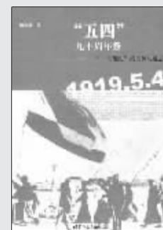
杨念群 著 世界图书出版公司 2009年1月出版

对“五四”运动，国内的解读长久以来存在着三种单一化倾向：或意识形态化的政治史叙事，或不加批判地套用西方自由主义的思想史分析，或以捍卫国学的名义否定“五四”批判精神。中国人民大学教授杨念群的这本新书认为，不应该对“五四”作过度的“思想史”分析，而应该将之“社会化”，更多地关注“五四”发生的社会环境，研究“五四”不同群体的行为差异及其后果。“五四”是中国社会长时段的全方位革新，它的“激荡”时间至少应拉长到20世纪30年代。正是来自基层社会重视实干、不看重空谈的气质推动了中国社会根本的变革。从这个认识出发，本书着重考察中国知识分子的“代际转换”以及与此相关的人际网络的变化轨迹，由此给出对“五四”“问题史”的新解释。